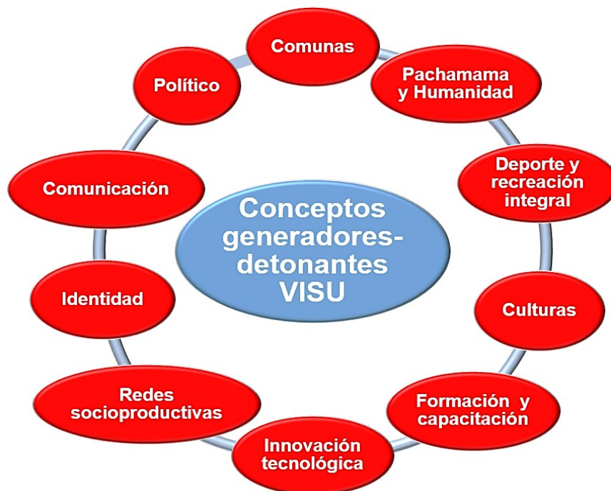
Infografía 02. Conceptos generadores como detonantes del Modelo VISU. (Elaboración propia, 2018).

El primer concepto generador son las Comunas como expresión de organización popular, hacia lo cual transita el Socialismo Bolivariano, el cual está en pleno proceso de construcción y requiere aportaciones de las y los universitarios desde la totalidad de la praxis revolucionaria, a fin de lograr el desencadenamiento de acciones concretas tales como: el acompañamiento a las organizaciones comunitarias en todas sus variantes, vale decir, comunas, consejos comunales, consejos campesinos, consejos de trabajadores y otros, que requieren de nuestras contribuciones para la elaboración de proyectos productivos a objeto de resolver problemas y necesidades, así como impulsar potencialidades.