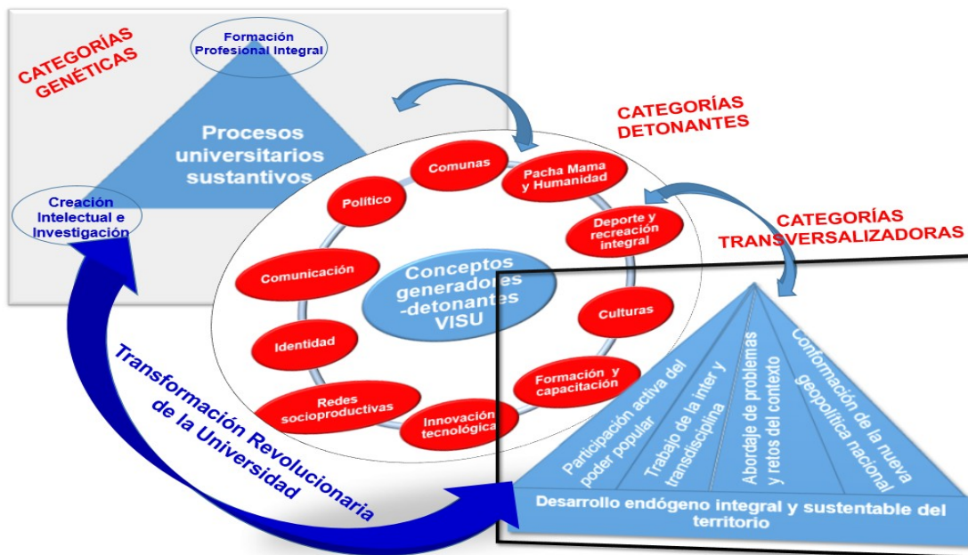
Infografía 04. Relaciones Orgánicas de las Categorías Estructurantes del Modelo VISU para la Transformación Universitaria (elaboración propia, 2019).