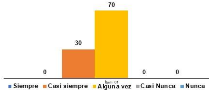
Figura 1. Representación de la distribución de la opinión de los encuestados en relación con la Participación activa de consejos comunales.

para la nueva gestión pública orientada a optimizar la participación de los ciudadanos como estrategia a de gobierno para el desarrollo local.