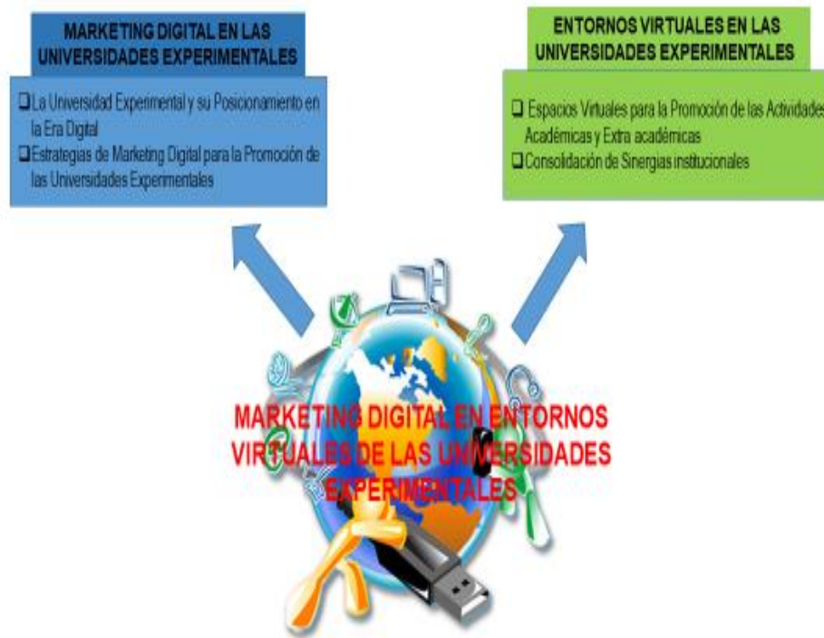
Figura 2. Elementos del Constructo Teórico de Marketing Digital en Entornos Virtuales de las Universidades Experimentales.

En función de los argumentos expuestos, se presenta en la Figura 2, los elementos contentivos del corpus teórico.