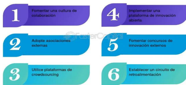
Figura 4. Comunidades de innovación

De este modo, la teoría de la innovación abierta, sugiere que las empresas pueden y deben usar ideas externas para avanzar en su tecnología y desarrollo, en vez de depender únicamente de sus propios recursos y capacidades, las organizaciones se benefician de colaborar con agentes externos, como universidades y otras empresas, cobrando relevancia en el contexto de la sostenibilidad, esta teoría permite comprender cómo la innovación abierta puede facilitar el acceso a tecnologías limpias, prácticas sostenibles y nuevas ideas que mejoren la eficiencia y reduzcan el impacto ambiental (figura 4).