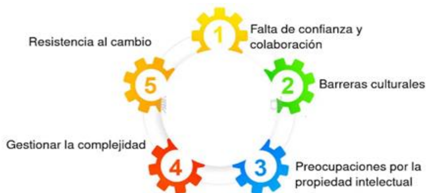
Figura 2. Superar los desafíos de la innovación abierta

La innovación abierta ofrece oportunidades excepcionales, pero también presenta fricciones y desafíos (Figura 2). En un proyecto de este tipo, suelen participar organizaciones de distintos tamaños, rutinas y culturas; aunque sus objetivos puedan alinearse, a menudo sus métodos y velocidades de trabajo son tan dispares que los proyectos pueden fracasar o demorarse excesivamente. Es común que el entusiasmo inicial se disipe ante estas complicaciones, lo que resulta en la pérdida de oportunidades.