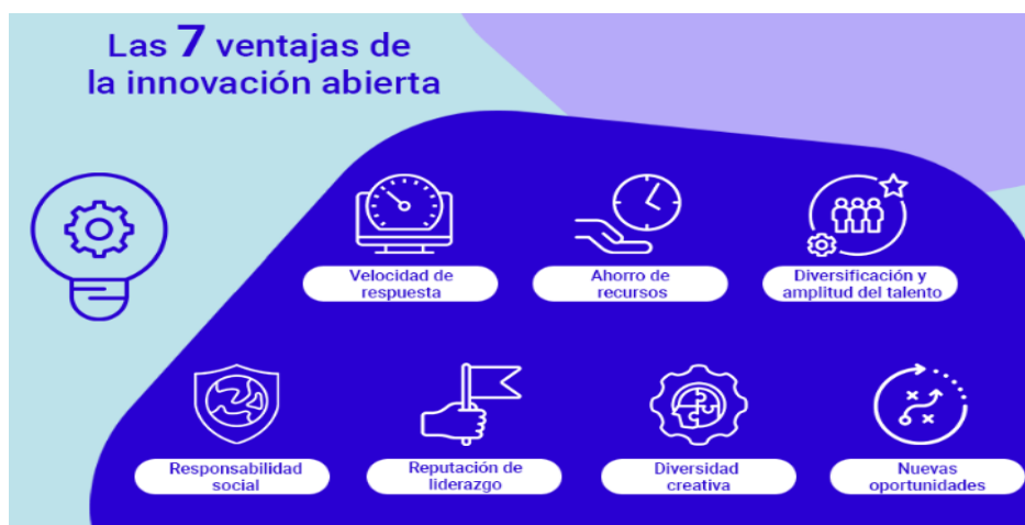
Figura 1. Beneficios de la innovación abierta